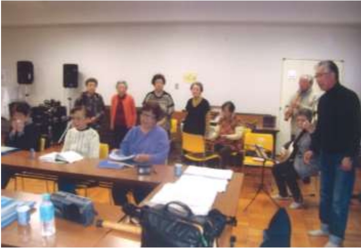
《コミセンでの練習風景》