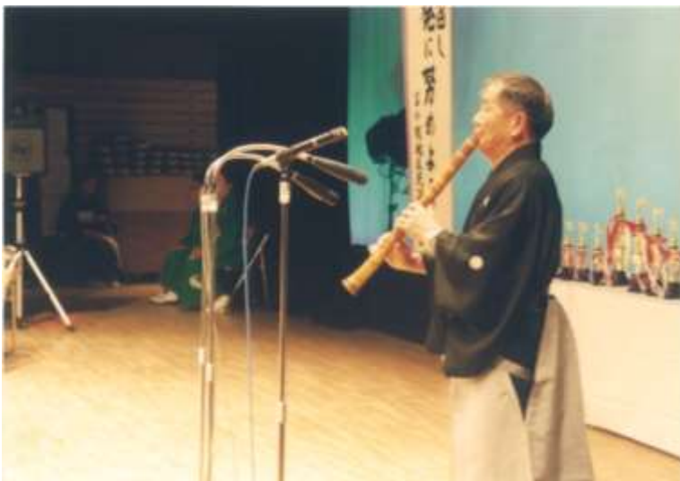
《苫小牧地区連選抜大会 令和元年5月》